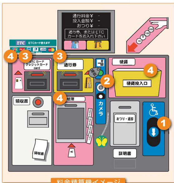
料金精算機イメージ